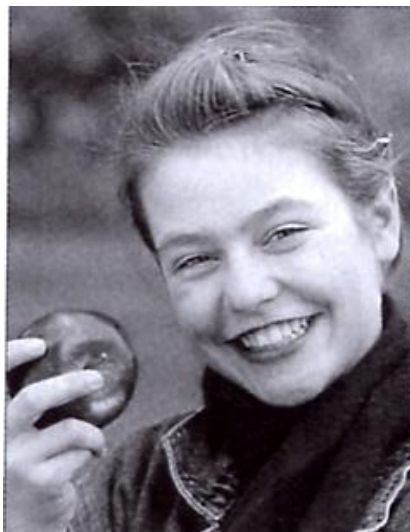
Photo prise en hiver