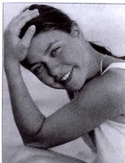
Photo prise en été

a. Comparez la teinte de peau de cette jeune fille entre l'été et l'hiver.